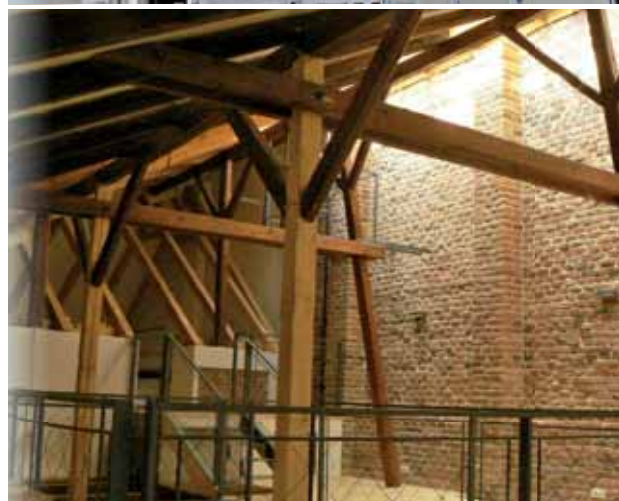
ukázky realizace PPN